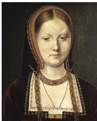
Catalina de A. Michel Sittow (1503-1504)

Aquel Papa, por desgracia, hacía depender sus decisiones de la política italiana, en lugar de velar por la Fe de la Iglesia. Catalina había escrito poco antes a Carlos V: "Si el actual Papa deshace lo que sus predecesores han hecho, ello afectará a su honor y a su conciencia, y desacreditará a la Sede Apostólica, que debe apoyarse firmemente en la Piedra que es Cristo. Si el Papa flaquea ahora, en este caso, muchos serán llevados por el mal