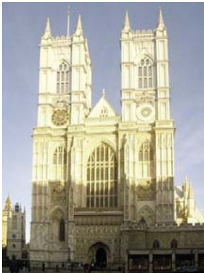
Abadía de Westmister

Entre tanto, el Emperador venció en Italia, el Papa avoca la causa a Roma. Catalina había triunfado sobre Wolsey, que se dirigía hacia su propia tragedia, pero ella, le mira sin odio, comprende que su lucha no es ya contra él, sino contra el demonio,