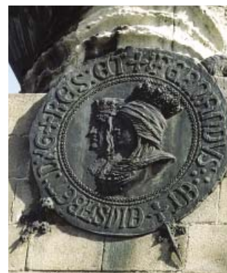
Valladolid. Medallón de los Reyes Católicos en el Monumento a Colón.

En las salas del Museo, magnífico marco ambiental, muy vinculado a la Reina, se habían habilitado 400 sillas, que fueron insuficientes para la afluencia de personas que se sumaron al acto.