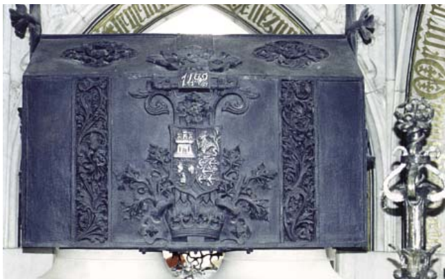
Ciudad de Santo Domingo. Edificio del "Faro a Colón" que cobija su sepulcro y, delante, la estatua de la Reina Católica que hizo posible la Empresa de Colón.

De aquella primera misa quedó una reliquia venerada por mucho tiempo. Esa reliquia fueron los ornamentos sagrados que vistió el celebrante. Eran un regalo de la Reina Católica que ella misma escogió de los que había en su capilla real. Da fe de ello, con emoción no disimulada, Fray Bartolomé de las Casas; escribió: "Los Reyes mandaron proveer de ornamentos para las Iglesias, de carmesí, muy ricos. Mayormente la Reina Isabel que dio entonces uno de su capilla, que yo ví y duró muchos años, muy viejo que no se mudaba o renovaba, por tenerlo casi como reliquia, por ser el primero y haberlo dado la Reina, hasta que de viejo no se pudo sostener más" (Tomo I, Cap. LXXXI).