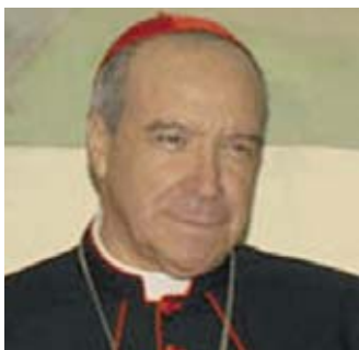
Cardenal Mons. Nicolás de Jesús López Rodríguez.

Hay que resaltar que en la triple dimensión del proyecto