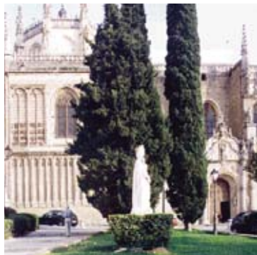
Monasterio de San Juan de los Reyes y Monumento a Isabel La Católica.

De la homilía del Cardenal Arzobispo de Toledo, Mons. A. Cañizares