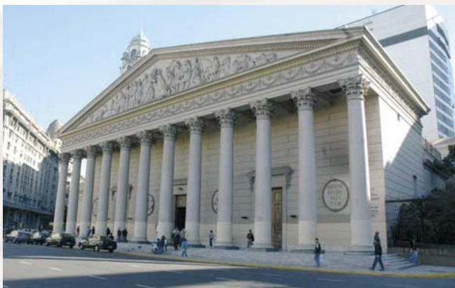
Fachada de la Catedral Metropolitana de Buenos Aires, Argentina.

"Comenzábamos la Santa Misa, acudiendo a la Santísima Virgen pidiéndole 'fortaleza en la fe, seguridad en la esperanza y constancia en el amor'. Acudamos a su intercesión, ahora, para que esos dones nos sean concedidos.