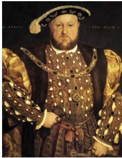
Enrique VIII de Hans Holbein (1539-1540)

por las que el breve original no debía salir en forma alguna de España, sino una copia autenticada ante notario, válida en cualquier tribunal eclesiástico. Este clérigo, una vez estuvo preparada la copia, regresó a Inglaterra y escribió un magnífico libro contra la pretensión de divorcio del Rey y lo publicó en plena campaña del terror, lo que le mereció pasar los seis últimos años de su vida en la Torre y ser ejecutado el 30 de julio de 1540, beatificado en 1886. Su libro: "Invicta veritas" . 4