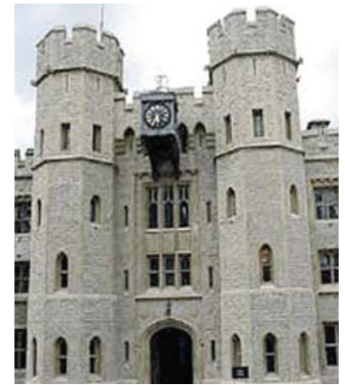
Torre de Londres

Esta propuesta era una auténtica revolución que iba a anular los derechos de propiedad obtenidos al amparo de la ley, todo esto se haría manteniendo las apariencias de orden público. El primer paso iba a ser intimidar al clero. El embajador español se movía inquieto comprendiendo que se estaba tramando algo muy serio.