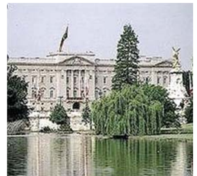
Palacio de Buckingham

Lo cierto es que el embajador llegó a Londres cargado de instrucciones, apenas había caído el gran Cardenal y cuando se acababa de cerrar el tribunal de Blackfriars, avocada la causa a Roma. Dispuesto estaba a poner a disposición de la Reina todas sus habilidades jurídicas y diplomáticas; buscaba, por el bien de la paz, reconciliar al Rey y la Reina.